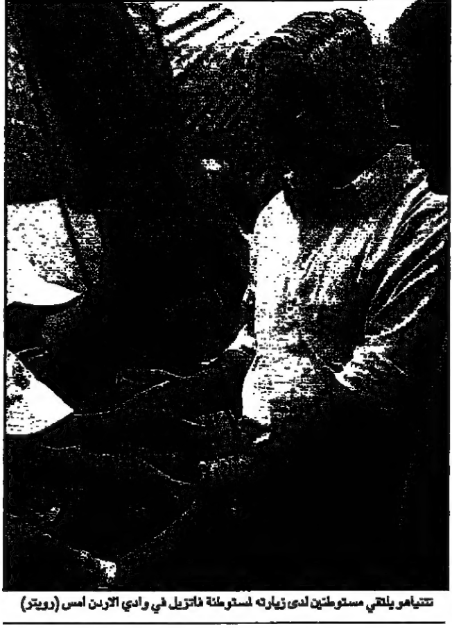
تنتاهو يلقى مستوطنين لدى زيارته استمرت ثلاثين في وادي الأردن (اسم (رويترز))

الامريكيون يقفون لان هناك 11 ألف منزل جديد على الاقل في مرحلة البناء إضافة إلى 6500 منزل من المقرر تشييدها على جبل أبو غنيم بالنقب الشرقية.